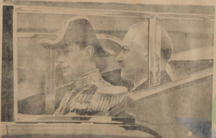
Foto di atas diambil waktoe Radja Inggris koendjoengken Frankryk. Di sam- pingnja Radja Inggris ada doedoek President Lebrun dari Frankryk. Menoeroet kawat ini hari maarschalk Petain telah ambil over pakerdja'an dari President Lebrun.